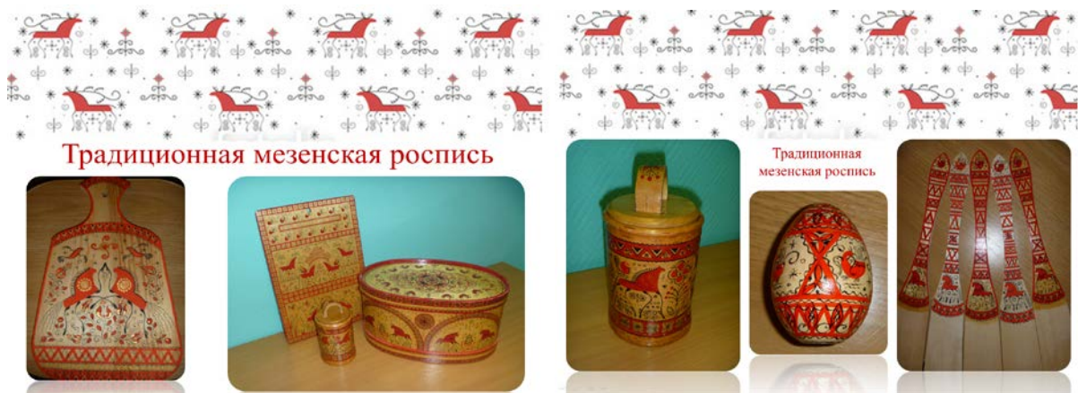
Традиционная мезенская роспись