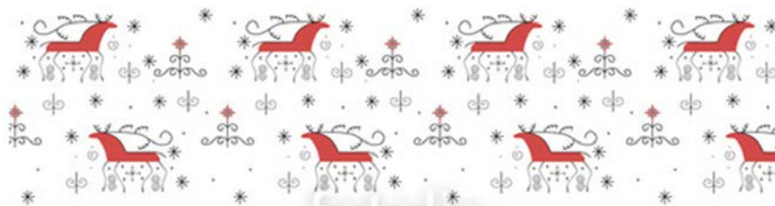
Мезенская роспись в оттенках синего. Мастер класс.