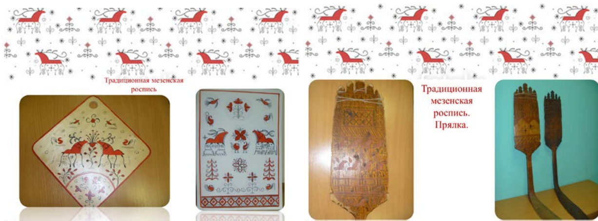
Традиционная мезенская роспись