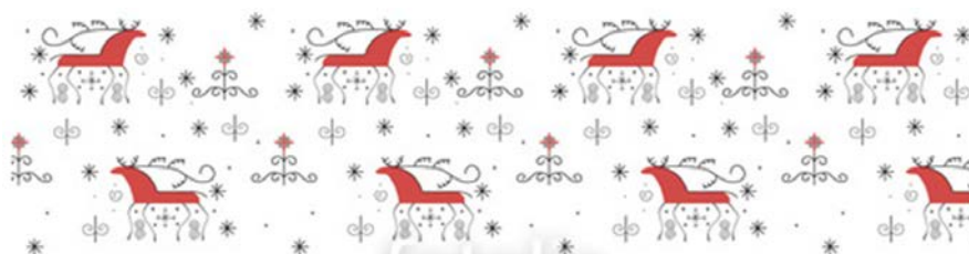
Мезенская роспись в оттенках синего. Мастер класс.